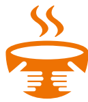
Ondervoeding lokale bevolking