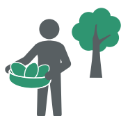
1. Kleine boeren (cacaobonen)

cacao is de complexe keten: van kleine boeren die de bonen verbouwen tot de chocola die in de winkel ligt.