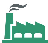
3. Snoepfabrikant (chocolade)