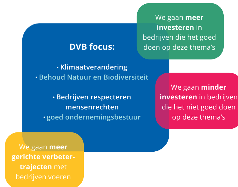
Figuur 2: Waar zetten we op in binnen de transities?

In de figuur hieronder geven we aan waar we op inzetten.