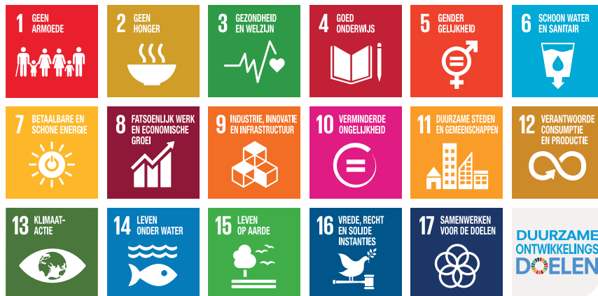
Figuur 2: VN Duurzame Ontwikkelingsdoelen