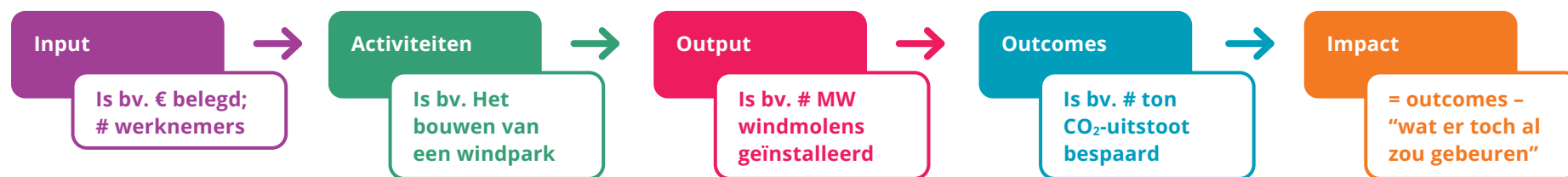
Figuur 1: Theory of Change, o.a. gebaseerd op: Erasmus Universiteit Rotterdam